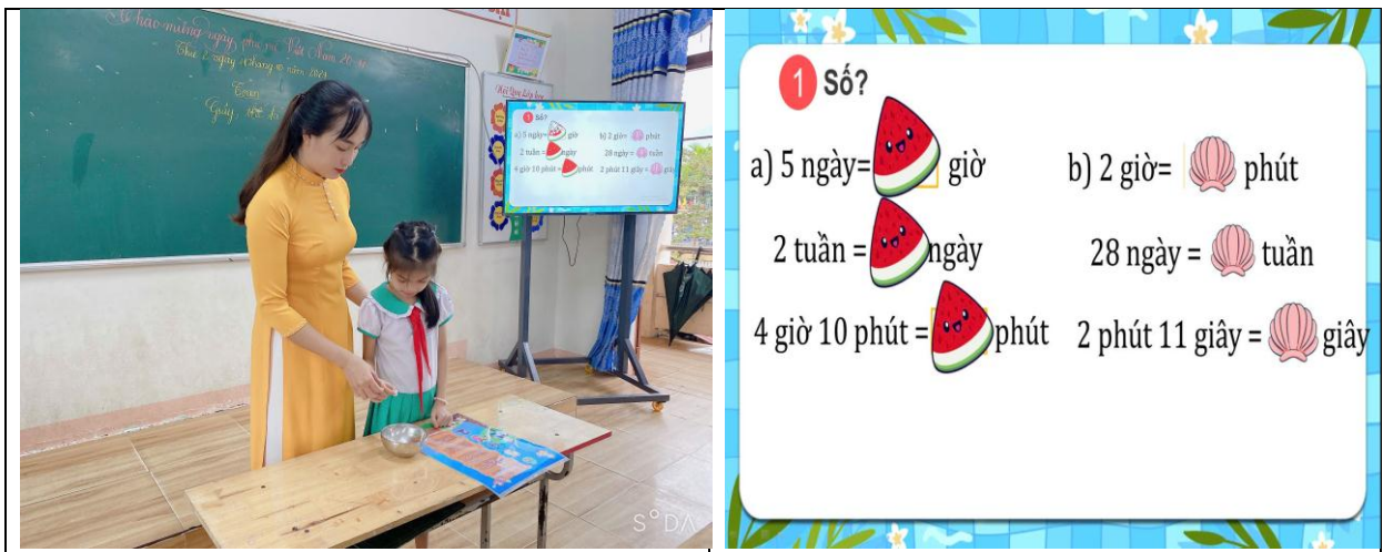
Hình ảnh chơi trò chơi “Gieo xúc xắc” của học sinh trong phần luyện tập.

Lần lượt từng em lên gieo xúc xắc, nếu gieo vào ô nào thì học sinh thực hiện theo yêu cầu ô đó.