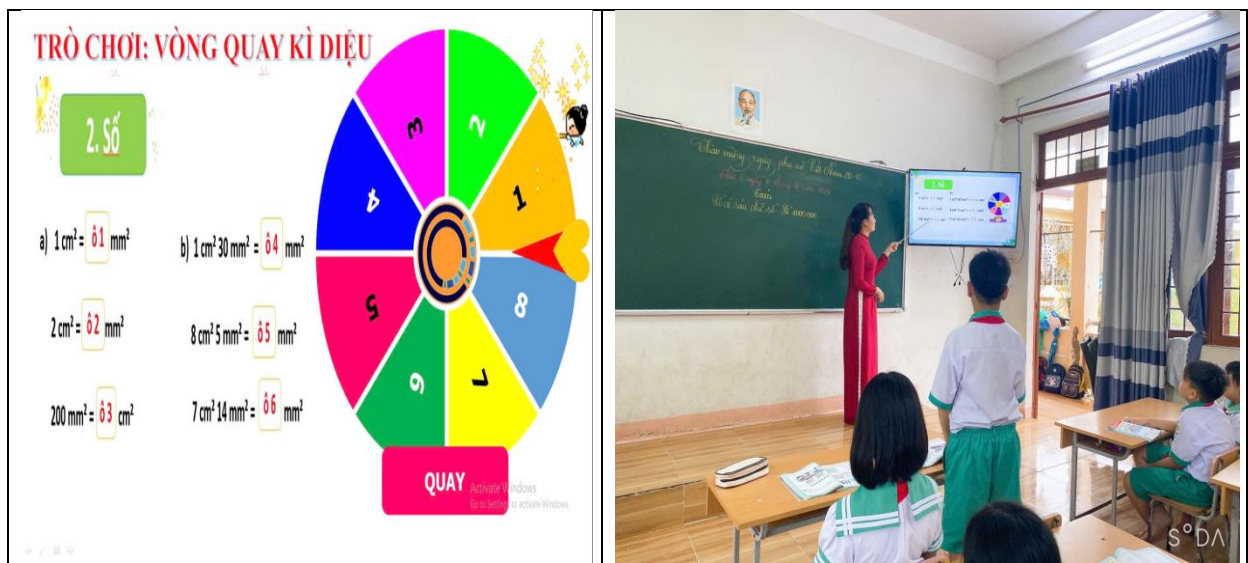
Hình ảnh trò chơi “Vòng quay kì diệu” của học sinh trong phần khám phá kiến thức.

Trong vòng quay kì diệu sẽ đánh số 1,2,3,4,5,6 học sinh chơi theo cá nhân, nếu vòng quay dừng lại ở ô số nào thì học sinh sẽ đưa ra đáp án tương ứng với ô trống có đánh số tương ứng. Trò chơi này làm cho học sinh rất hứng thú, giúp các em rèn luyện khả năng ghi nhớ, trình bày, chia sẻ.