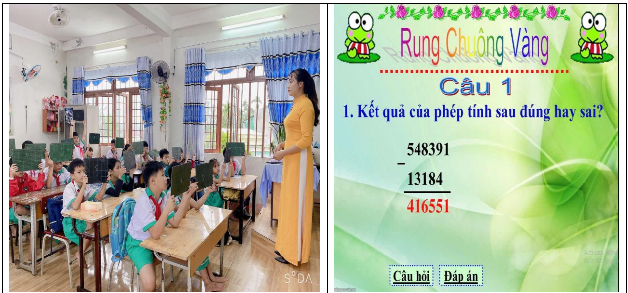
Hình ảnh chơi trò chơi “Rung chuông vàng” của học sinh trong phần khám phá kiến thức.

Để giúp học sinh vận dụng kiến thức bài học, tôi cho các em tham gia trò chơi “Rung chuông vàng”. Học sinh sẽ giơ bảng để trả lời những câu hỏi mà giáo viên xây dựng trong trò chơi. Trò chơi đã giúp các em phát huy tính năng động, tích cực, tư duy sáng tạo và nhanh nhạy trong học tập.