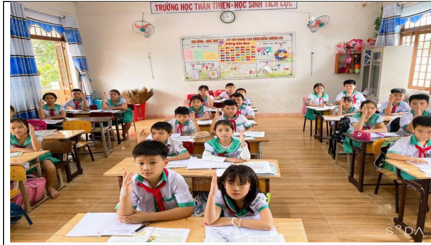
Hình ảnh học sinh tham gia phát biểu sôi nổi, tích cực trong học môn Toán.