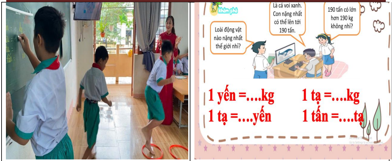
Hình ảnh chơi trò chơi “Thi tiếp sức” của học sinh trong phần khám phá kiến thức.