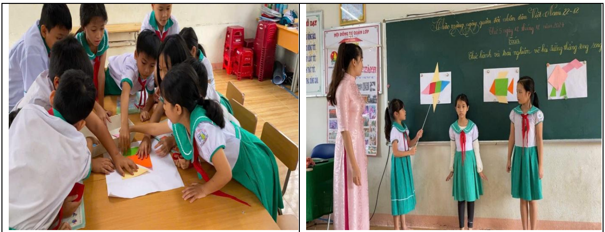
Hình ảnh chơi trò chơi “Thi ghép hình” của học sinh trong phần luyện tập.

Để giúp học sinh có thể sử dụng các hình có hai đường thẳng vuông góc, hai đường thẳng song song ghép thành hình các đồ vật, con vật tôi sẽ tổ chức cho các em chơi trò chơi “Thi ghép hình”, nhóm nào ghép xong nhanh nhất nhóm đó thắng cuộc.