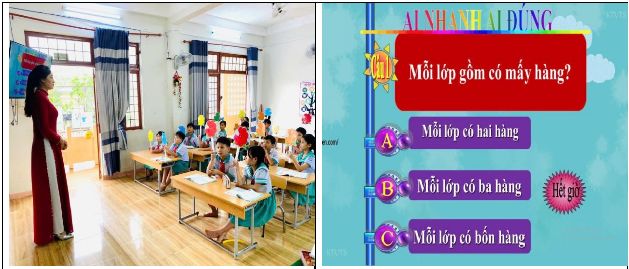
Hình ảnh trò chơi “Ai nhanh-ai đúng” của học sinh trong phần khởi động.

Khi nghe giáo viên đọc câu hỏi xong, học sinh suy nghĩ trong 5 giây, hết thời gian các em chọn đáp án A, B, C, D. Trò chơi đã giúp các em có tâm thế thoải mái, hứng thú trước giờ học.