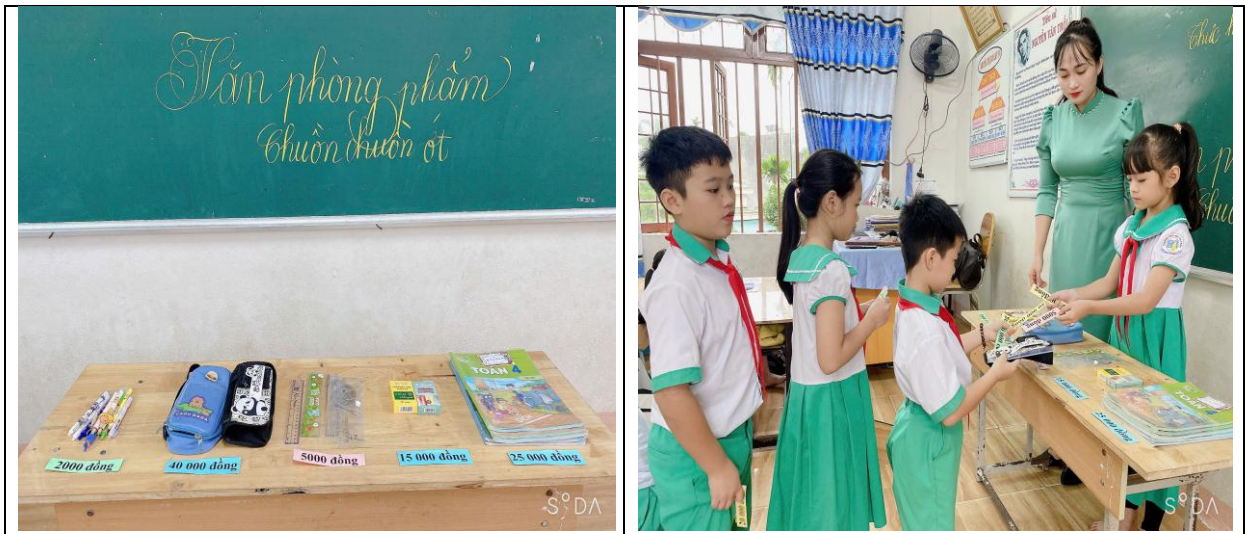
Hình ảnh chơi trò chơi “Giúp mẹ đi chợ” của học sinh trong phân luyện tập.

Trò chơi này giúp các em rèn khả năng tính toán cộng trừ nhanh, và được trải nghiệm cuộc sống thực tế.